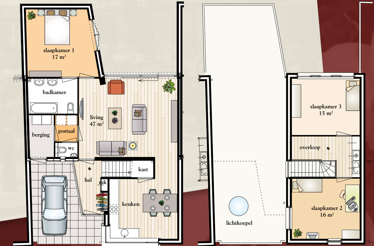
Type Hendrik, Begane grond

een apart toilet. Op de eerste verdieping bevindt zich de overloop en een tweede en derde slaapkamer. Woningnummer 6 van dit type heeft bovendien een erker aan de zijkant van de woning. Het geeft een uitbreiding aan zowel de living als aan het kookgedeelte.