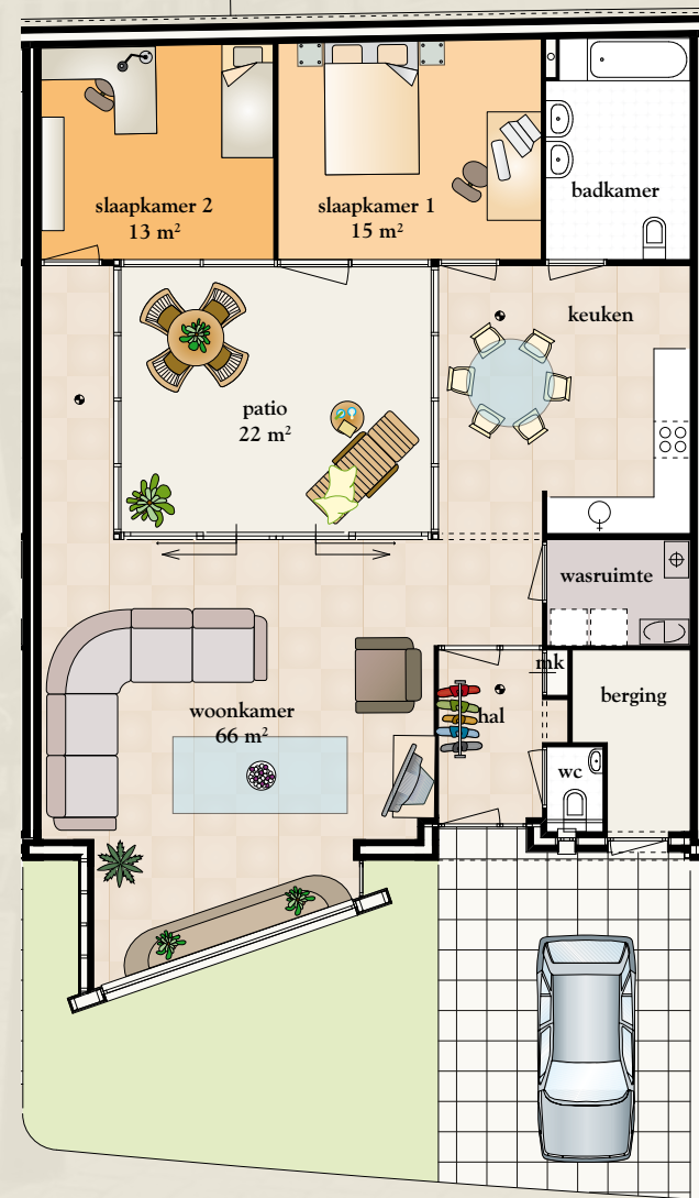
Type Engelbrecht, Begane grond (bouwnummer 19)

De 23 woningen in Hofhaege combineren uitstekend bij de uitstraling van de bestaande bebouwing rondom de Haagweg. De woningen worden gebouwd in twee typen: type Engelbrecht (6 patiowoningen) en type Hendrik (17 eengezinswoningen).